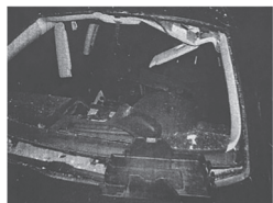
Das gesprengte Auto (Aktenfoto)

Keins von den fünf Autos, die außer Andrés Fahrzeug auf dem Parkplatz standen, hatte noch Scheiben. Alle Türen seines Autos waren nach außen hin verbogen, das war ein Schaden von 11.000 bis 15.000 Euro. Die