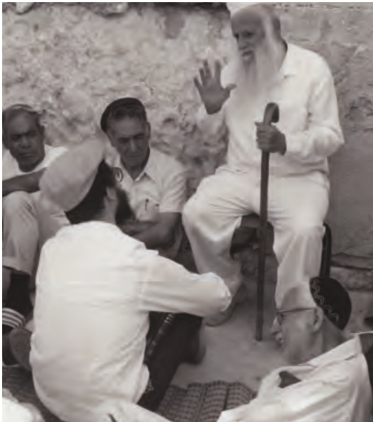
Klagemauer in Jerusalem, 1988. Am Tisha B'Av sitzen Männer oft an der Klagemauer und singen die Klagelieder aus der Bibel während sie fasten.

„ 19 So spricht der HERR der Heerscharen: Das Fasten des vierten und das Fasten des fünften und das Fasten des siebten und das Fasten des zehnten Monats wird dem Haus Juda zum Jubel und zur Freude und zu fröhlichen Festzeiten werden. Doch die Wahrheit und den Frieden liebt! 20 So spricht der HERR der Heerscharen: Noch werden Völker und Bewohner vieler Städte kommen; 21 und die Bewohner der einen werden zu anderen gehen und sagen: Lass uns doch hingehen, den HERRN um Gnade anzuflehen und den HERRN der Heerscharen zu suchen! Auch ich will gehen! 22 Und viele Völker und mächtige Nationen werden kommen, um den HERRN der Heerscharen in Jerusalem zu suchen und den HERRN anzuflehen. 23 So spricht der HERR der Heerscharen: In jenen Tagen, da werden zehn Männer aus Nationen mit ganz verschiedenen Sprachen zugreifen, ja, sie werden den Rockzipfel eines jüdischen Mannes ergreifen und sagen: Wir wollen mit euch gehen, denn wir haben gehört, dass Gott mit euch ist.“